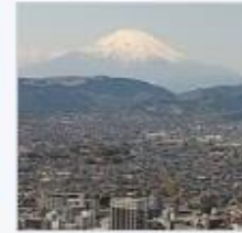
権現山（弘法山公園）