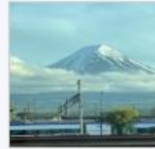
石割山（富士山口駅）