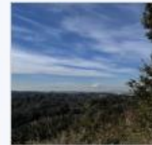
鎌倉・勝上献展望台