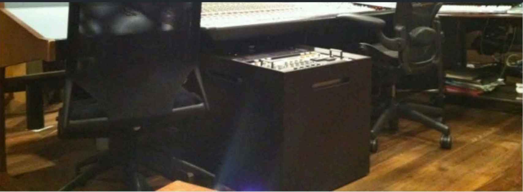
変な声！と思った いつ聞いたのか忘れたけど、相葉ちゃんが録音さ